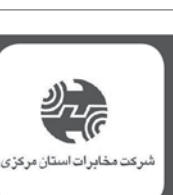
شرکت مخابرات استان مرکزی

این عضو کمیسیون عمران در پایان خاطرنشان کرد: در کمیسیون تلفیق در مورد میزان بودجه ای که برای این بخش در نظر گرفته شود، بحث می شود، اما با این حال باید زوایای مختلف مسئله را بسنجیم. ولی با این وجود لازم به ذکر است که مجموعه همکاران مجلس را نسبت به این مسئله حساس می بینم و آنها تمایل بسیاری به حمایت از طرح دارند.