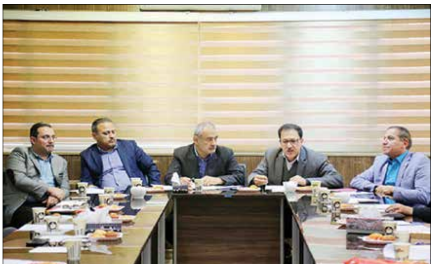
برای انتشار آگهی دادگستری در سامانه الکترونیک مواد ۶۱۶، ۲۴۴، ۱۷۴ و ۲۸۴ قانون آیین دادگستری با مواد ۷۳ و ۳۰۲ و ۳۴۳ آیین دادرسی مدنی و کیفری در تعارض است و تمامی مواد مذکور بر انتشار

آگهی ها در روزنامه های کثیرالانتشار تاکید دارد لذا حاضرین در این جلسه، طی نامه ای سرگشاده خواستار رسیدگی و لغو بخشنامه دادگستری شدند. این مدیران مسئول در نهایت نامه ای را به امضا رساندند که متن آن به شرح زیر است: امروز جامعه ایرانی در شرایط خاص به ویژه تحریم و جنگ نرم و رسانه ای جهان سلطه قرار داشته که مقابله و دفاع را ایجاب و وظیفه شرعی و میهنی تک تک آحاد رسانه ای کرده است تا به عنوان افسران جنگ نرم بتوانند از هویت انقلاب اسلامی دفاع کنند که این انجام وظیفه مورد تاکید مقام معظم رهبری قرار گرفته است. لذا به عنوان رهنمونی برای تمامی تصمیم سازان لازم الاجراست.